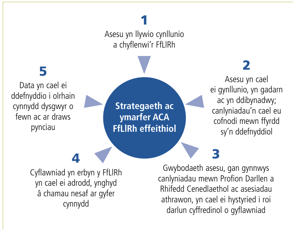
Ffigwr 1: Strategaeth ac ymarfer ACA FfLIRh effeithiol